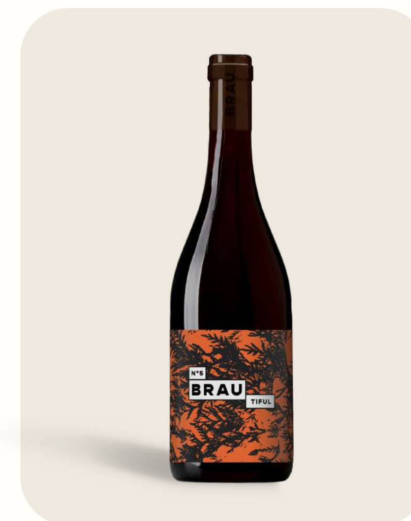
Rouge N°5 BrauTiful

Pêche & abricot | Peach & apricot Vin de France