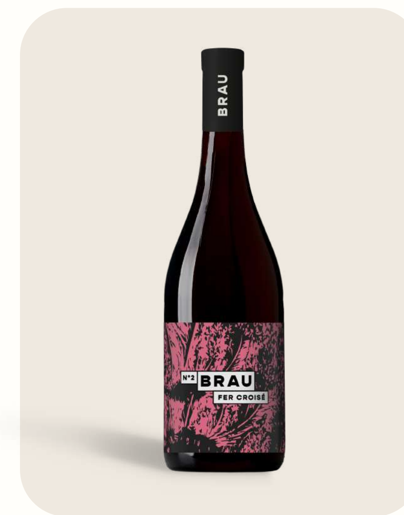
Rouge N°2 Fer Croisé