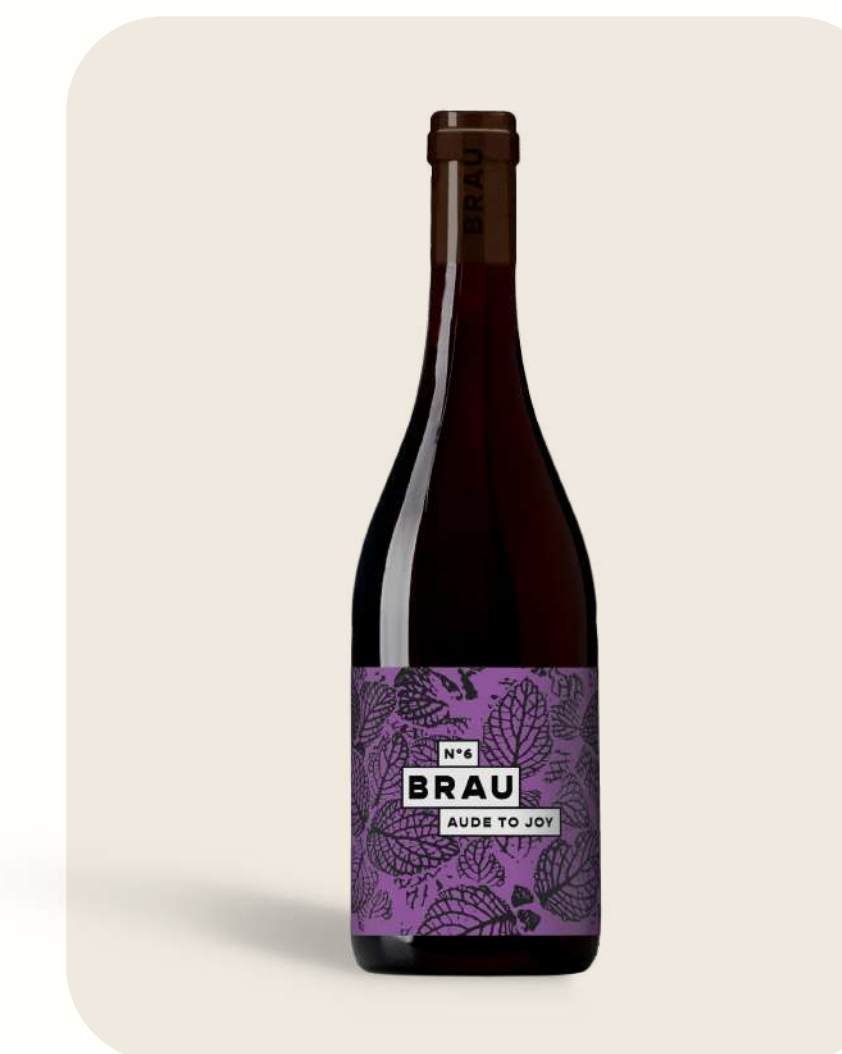
Rouge N°6 Aude to Joy

Grenade acidulée | Juicy pomegrade Vin de France