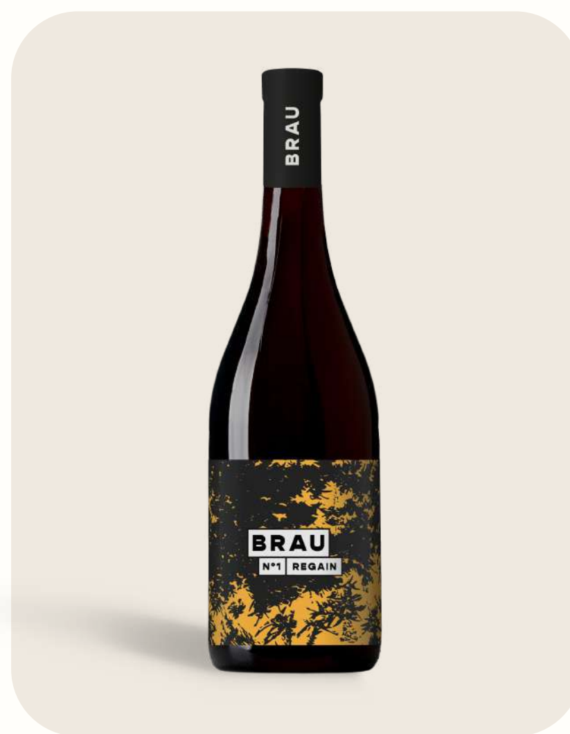
Rouge N°1 Regain

Indigenous yeast, without fining & no added sulfites. Original flavors, intensely fresh and fruity, while remaining straight without funkiness.