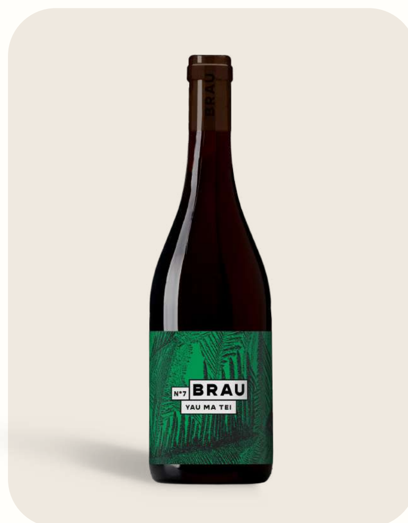
Rouge N°7 Yau Ma Tei

Fruits rouges compotés Intense red fruits Vin de France