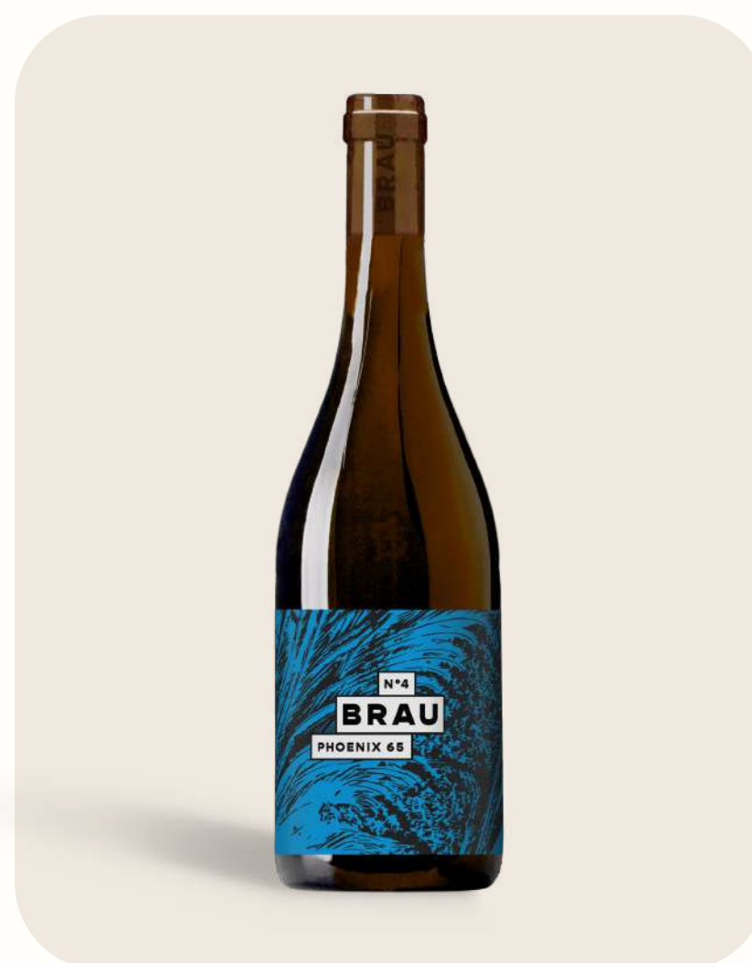
Blanc N°4 Phoenix 65