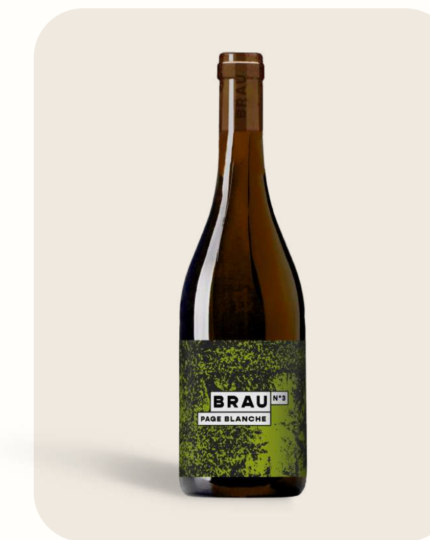
Blanc N°3 Page Blanche

Poivron vert, fruits rouges, arômes métalliques | Green pepper, black fruits & metallic flavor Vin de France